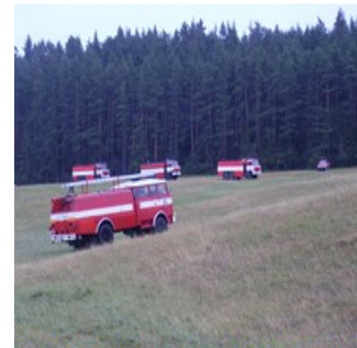
zabezpečuje dostatok hasiacej látky