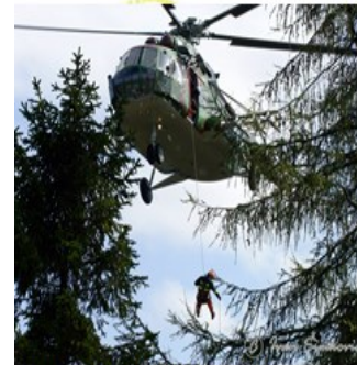
vykonáva záchranu osôb ohrozených požiarom