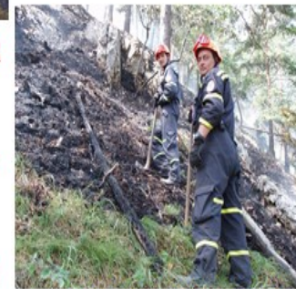
podieľa sa na likvidácii ohnísk

Fyzická osoba je povinná: dodržiavať vyznačené zákazy a plniť príkazy a pokyny týkajúce sa ochrany pred požiarmi, dodržiavať zásady protipožiarnej bezpečnosti pri činnostiach spojených so zvýšeným nebezpečenstvom vzniku požiaru alebo v čase zvýšeného nebezpečenstva vzniku požiaru, oznámiť bez zbytočného odkladu príslušnému okresnému riaditeľstvu hasičského a záchranného zboru požiar, ktorý vznikol v objektoch, priestoroch alebo na veciach v jej vlastníctve, zabezpečovať pravidelné čistenie a kontrolu komínov, dodržiavať pri manipulácii s horľavými látkami a horenie podporujúcimi látkami požiadavky na protipožiarne bezpečnosť, umožniť orgánom štátneho požiarneho dozoru vykonávanie potrebných úkonov pri zisťovaní príčin vzniku požiarov, zabezpečovať plnenie opatrení v súvislosti s ochranou lesov pred požiarmi.